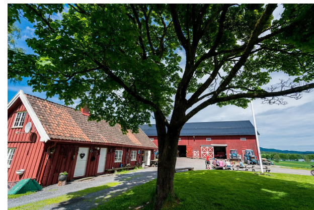
Lørdag 13.10: Tur til Skjerven gård.